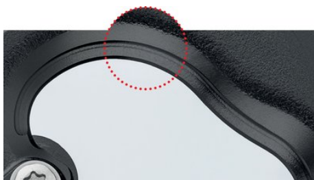
режущая кромка с прецизионной фрезеровкой и закалкой токами высокой частоты