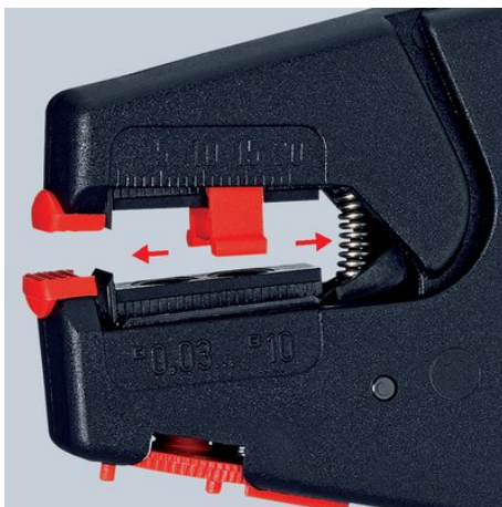
Передвижной ограничитель длины