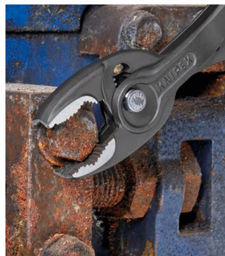
Коробчатый шарнир является прочным и гибким, поэтому клещи могут удерживать детали в диапазоне от 4 до 22 мм.