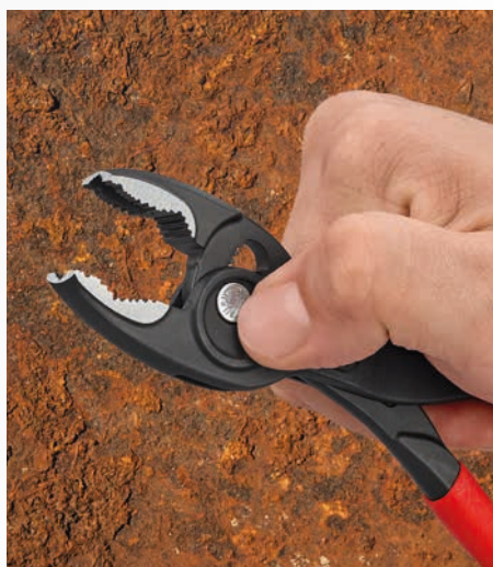
... и положение можно быстро изменить одним нажатием на кнопку!