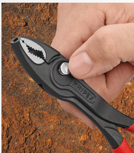
KNIPEX TwinGrip позволяет гибко настраивать ширину захвата в пяти положениях...

Оптимизированная геометрия губок: 2-зональная губка с противоположным выравниванием зубцов для максимального захвата при откручивании и затягивании.